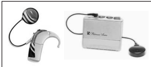
サウンドプロセッサ(体外装置)