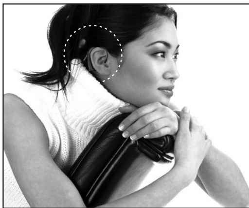
サウンドプロセッサを装用している様子