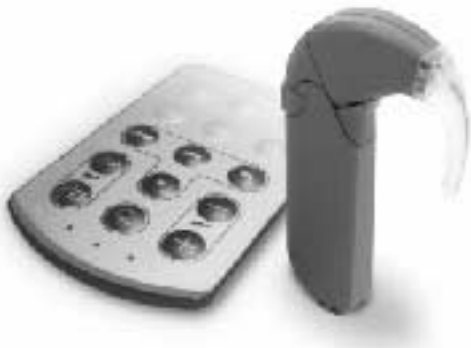
▲人工内耳 スピーチプロセッサ

人工内耳は補聴器でも音を聞くことができない重度の難聴者にとって「音のない世界から音のある世界へ」の大きな福音となっています。しかし人工内耳は手術をするだけでなく聞こえるものではなく、適切な指導訓練が重要です。また、より良い聞こえのために、正しい知識をもつことも大切です。